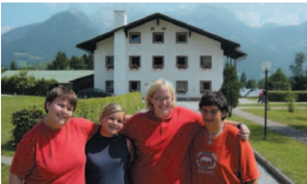
Das Adipositas-Rehazentrum Insula liegt in Berchtesgaden in Süddeutschland.

Das Übergewicht hat erhebliche Auswirkungen auf die Berufs- und Erwerbsfähigkeit. Eine Belastungs-Atemnot, eingeschränkte Beweglichkeit, erschwertes Klettern und Steigen sowie eingeschränkte Wegstrecken sind bei vielen Berufen hinderlich und machen oft deren Ausführung unmöglich. Jugendliche mit Übergewicht haben deshalb oft Schwierigkeiten eine Lehrstelle zu finden und sind ohne persönliche und berufliche Lebensperspektive. Um der Not dieser zahlreichen jungen Menschen zu begegnen, hat die Stiftung deStarts in Zusammenarbeit mit anerkannten Fachleuten die erste interdisziplinäre Übergewichts-Therapie mit gezielter Förderung der beruflichen Eingliederung in der Schweiz aufgebaut. Die Adipositas-Therapie des Instituts St. Joseph Guglera wurde mit dem international anerkannten Spezialisten Herrn Dr. med. W. Siegfried, ärztlicher Leiter des Adipositas-Rehazentrum INSULA, ( www.insula.de ) entwickelt.